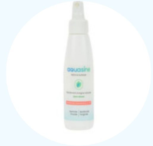
AQUASINE Manos y superficies