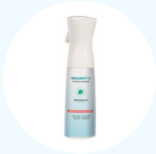
AQUASINE Superficies y material