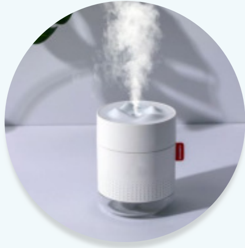
AQUAHOME 500 ML (de 1 à 5m 2 ) +2 litres Aquasine brumisation Dilution de 25% à 50%