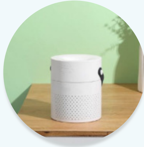
AQUAHOME 1 Litre (de 8 à 12m 2 ) +5 litres Aquasine brumisation Dilution de 25% à 50%