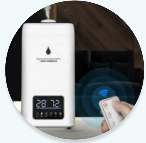
AQUAHOME 24 Litres (de 50 à 120m 2 ) +40 litres Aquasine brumisation Dilution de 25% à 50%